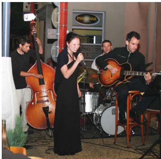
Au Bistrot du sud

Une fête de la musique éclatée dans les quartiers.