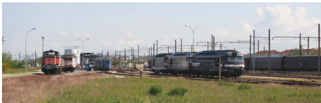
La gare de triage de Portes : déclin ou nouvelle jeunesse ?