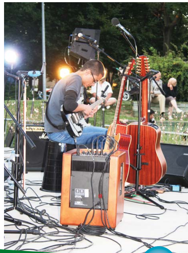
Sur la scène au Théâtre de verdure