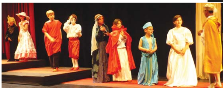
"le banquet de Barbe bleue" avec les enfants

Pour la saison 2009-2010, AJT reconduit le même dispositif : un atelier adulte débutant et confirmé le jeudi de 20 h 30 à 23 h, un