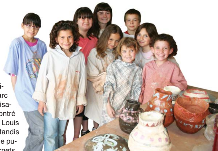
Les enfants du cours de poterie