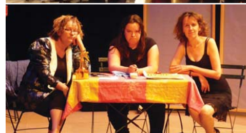
"Le coin des divorcées" joué par des adultes