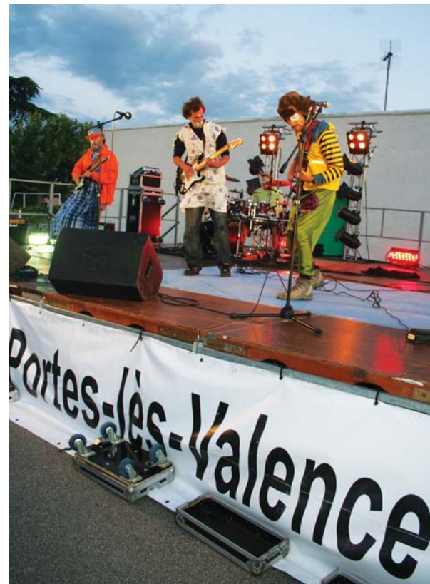
Sur la scène à l'école Fernand Léger

La fête de la musique a battu son plein le samedi 20 juin dans les quartiers de la ville et sous un mistral plutôt gaillard. Au terrain de sport de l'école Fernand Léger, une scène offrait du rock et métal tandis qu'au parking derrière l'école Voltaire, les amateurs de rap, de hip hop et de R'n'b s'étaient donné rendez-vous. À saluer, pour cette scène, la brillante prestation pleine d'humour et d'énergie, des jeunes de la MJC qui, avec leurs collègues de Vénissieux, se prêtèrent à une sorte de remake de West side story. Le parc Léo Lagrange servait de théâtre au tremplin sur le thème "Carnets de voyage". Un jury devait déterminer lequel des artistes se présentant ferait la première partie de Johnny Clegg. Deux restaurants de la ville proposaient eux aussi, le samedi soir, des animations musicales : du jazz latino au Bistrot du sud et du jazz manouche à la pizza Joss. Le Mencarelli avait quant à lui choisi le dimanche 21 pour son animation musicale.